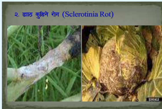
२. डाठ कुहिन रोग (Sclerotinia Rot)