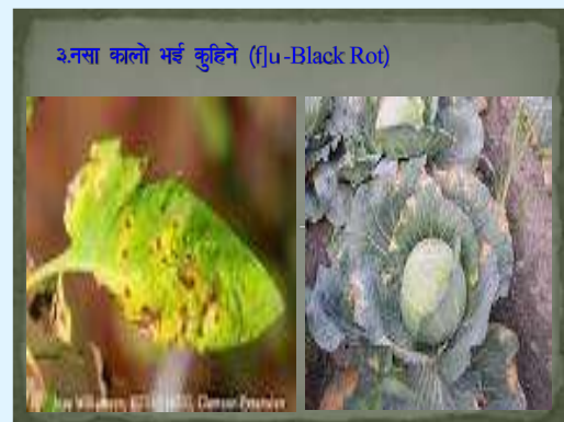
३. नसा कालो भई कुहिन (fju-Black Rot)