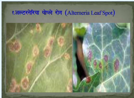
१. अल्टरनेरिया थोप्ले रोग (Alternaria Leaf Spot)