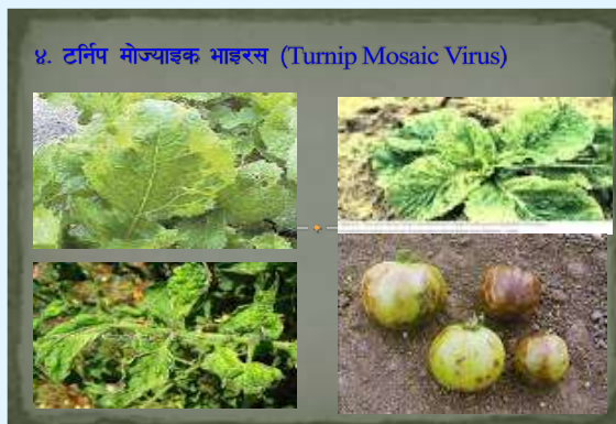
४. टर्निप मोज्याइक भाइरस (Turnip Mosaic Virus)